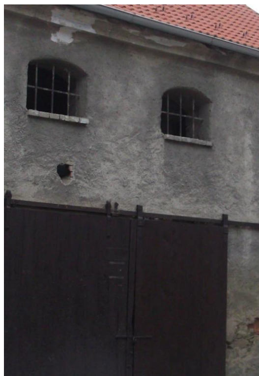
Pozůstatky židovské synagogy