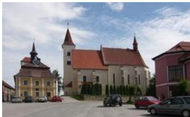
Náměstí s radnicí a kostelem