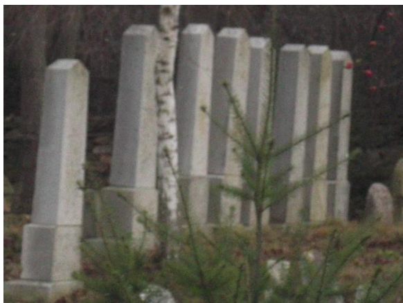
Židovský hřbitov v Načeradci