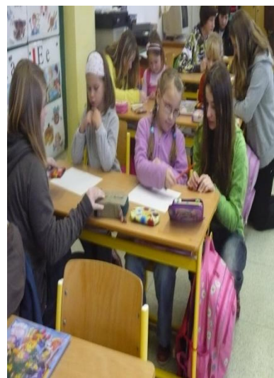
Dopis Ježíškovi od prvňáčků